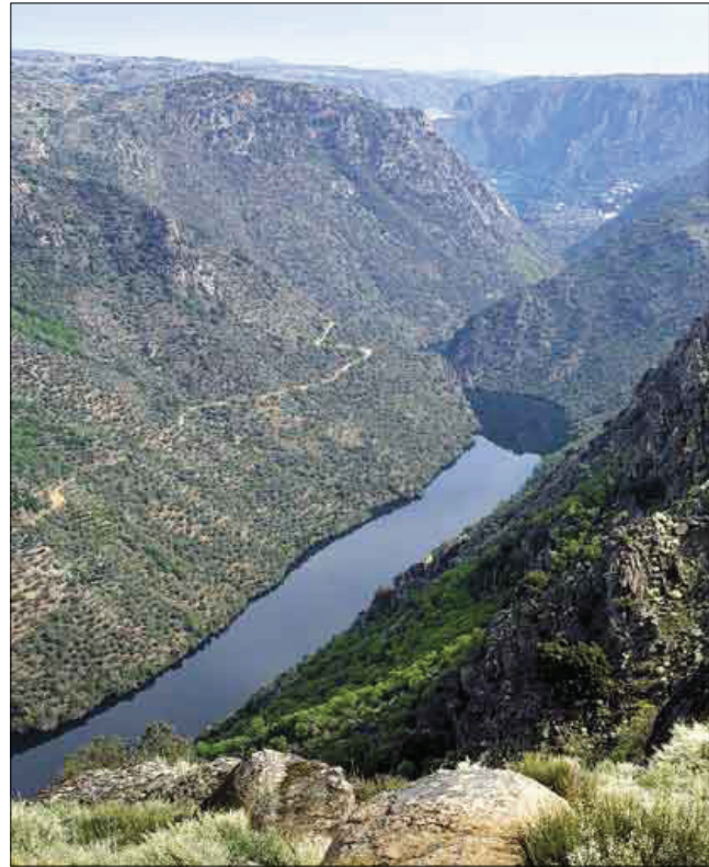
Vista de uno de los miradores de Las Arribes.

Asimismo, el turismo se ha diversificado ofreciendo actividades muy variadas, como ferias de artesanía, rutas teatralizadas, marchas por los senderos, visitas a los puntos de elaboración de alimentos, etc. En definitiva, una oferta rica que se complementa con los acontecimientos propios de cada pueblo, como sus fiestas populares, sus tradiciones religiosas, sus costumbres sociales... Una comarca en auge que explota sus recursos y comparte su riqueza.