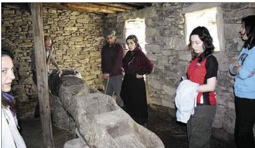
Algunos de los actores que interpretan las visitas en una de ellas.